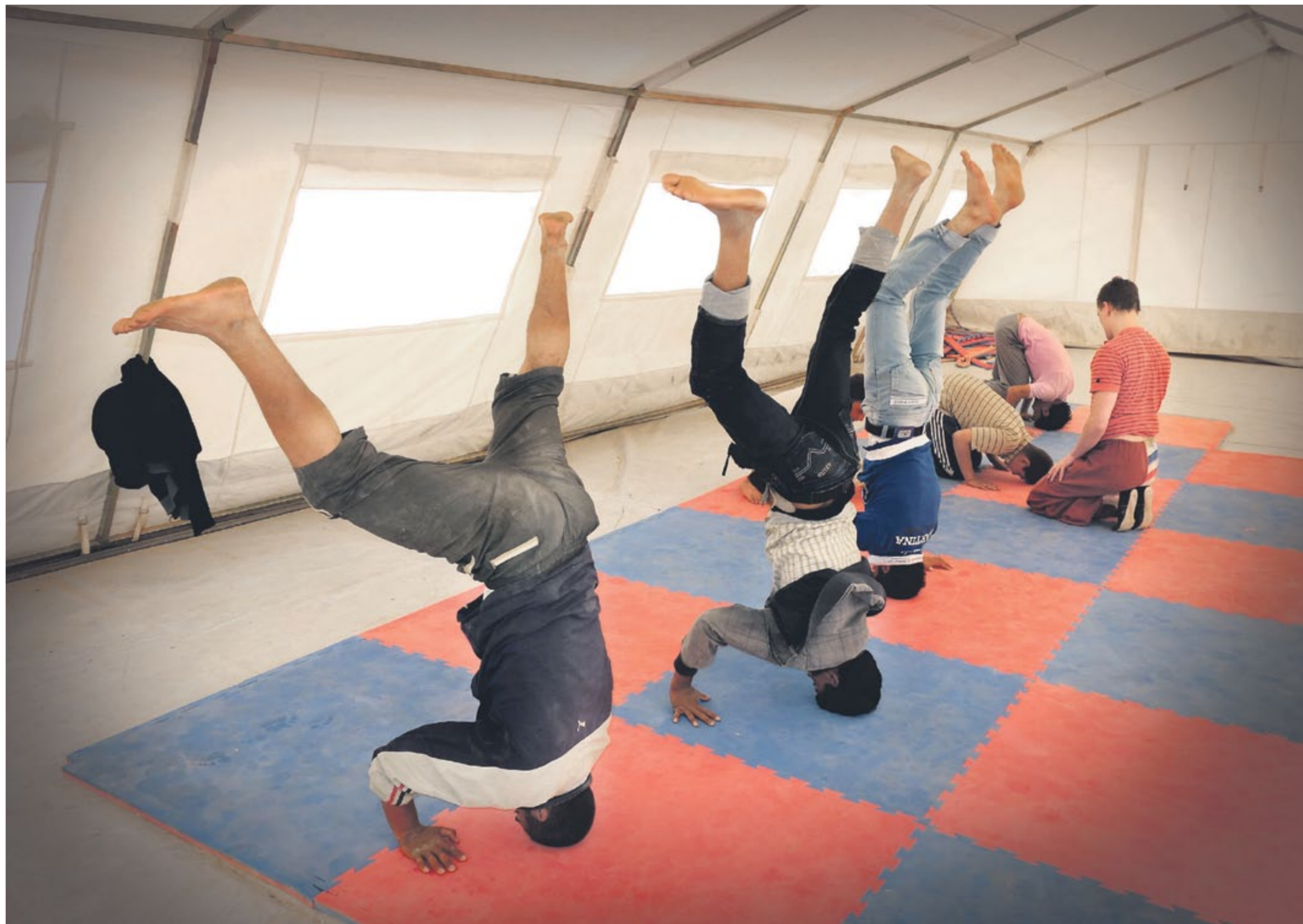
CIRKUSTÄLT. Varje vardag får pojkarna och flickorna på flyktinglägret Zaatari träna olika cirkusgrenar i varsett tält på Kyrkans utlandshjälpens område. Det är bra både för fysiken och för psyket. SIRKUS MAGENTA